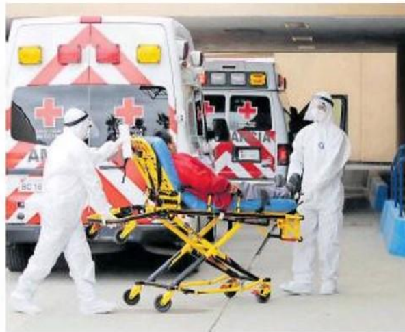
Esperaban un aumento de padentes con la reapertura de actividades

SUMAN TRES MIL 654 las muertes por coronavirus y 20 mil 349 las personas positivas al SARS-CoV-2, desde el 8 de marzo a la fecha